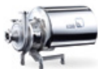
Vitacast® en standard

Pour plus d'informations : www.ksb.com/produits